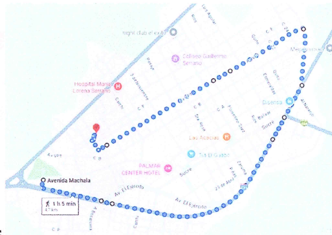
GRAFICO DEL RECORRIDO:

trayecto, garantizando la seguridad de los ciclistas y el orden en el recorrido. Gracias a su colaboración, los asistentes pudieron desarrollar la actividad de manera segura y organizada, lo que permitió mantener el entusiasmo y la motivación en cada etapa del ciclo paseo.